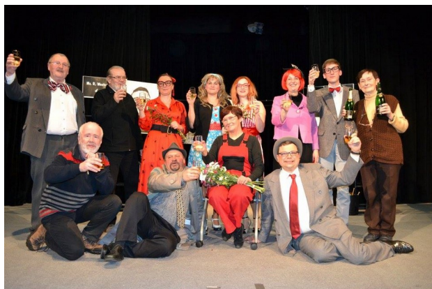
* Děníera – Paní Piperová zasahuje