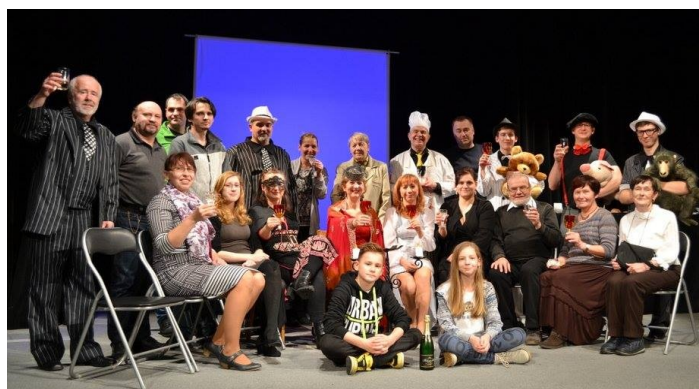
* Don Andronico