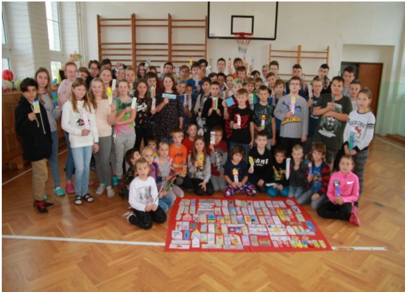
Slavnostní zakončení projektu Záložka do knihy spojuje školy